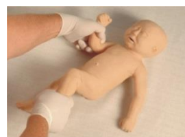
リアルな動きを再現できる胎児

納入先お客様向けで取扱い方法を解り易く記載したクイックガイドをお配りいたします。